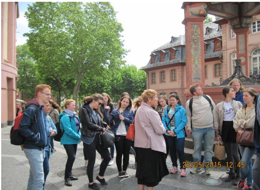
Zwiedzanie Moguncji - stolicy Nadrenii-Palatynatu

Oczywiście nie zabrakło zwiedzania, grupa odwiedziła stolicę Nadrenii-Palatynatu - Moguncję (Muzeum Gutenberga, Katedrę) oraz uniwersyteckie miasto Heidelberg, podróżowała promem po Renie, podziwiała okoliczne zamki i ruiny oraz malownicze krajobrazy nadreńskie. Wróciliśmy bardzo zadowoleni z pobytu i pełni wrażeń teraz oczekując na rewizytę uczniów niemieckich, która nastąpi już niedługo - w dniach 15-19 czerwca.