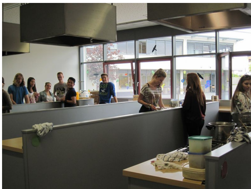
Ostatnie zajęcia - wspólne gotowanie