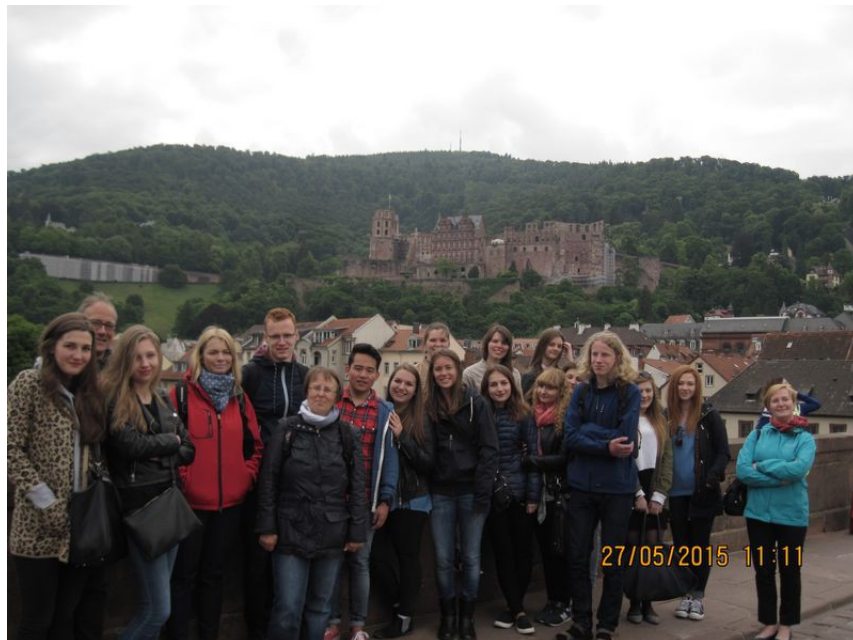
Heidelberg nad Neckarem - na Alte Brücke z ruinami zamku w tle.