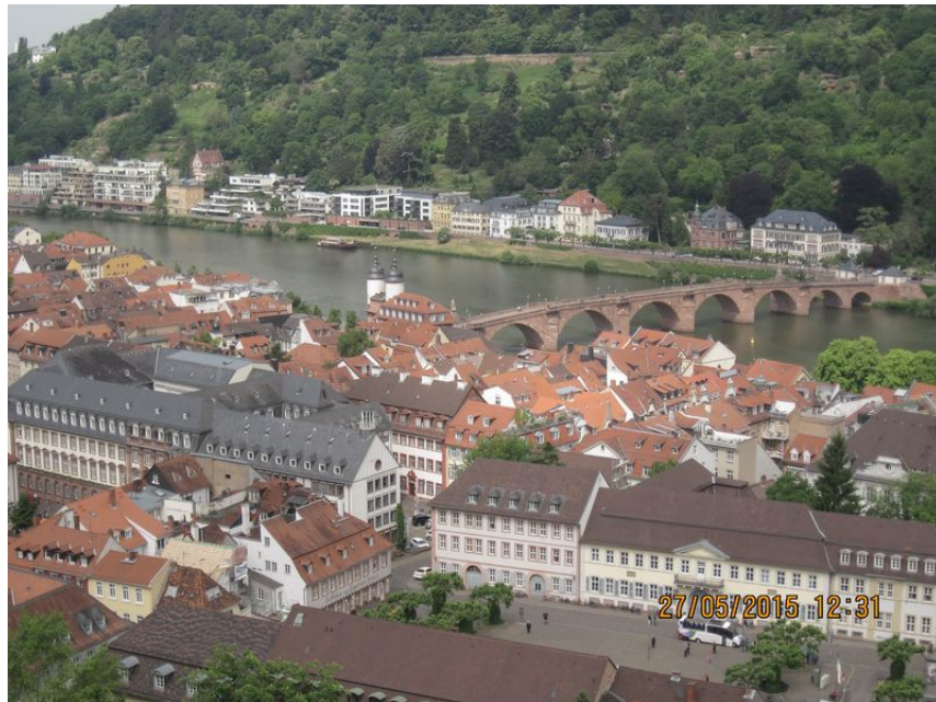
Heidelberg - widok z zamku