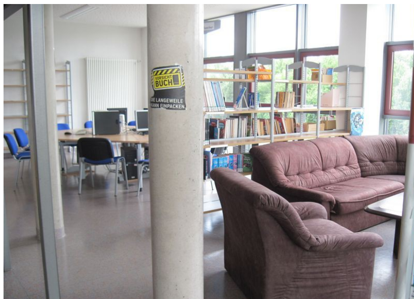
Biblioteka i czytelnia IGS Stromberg