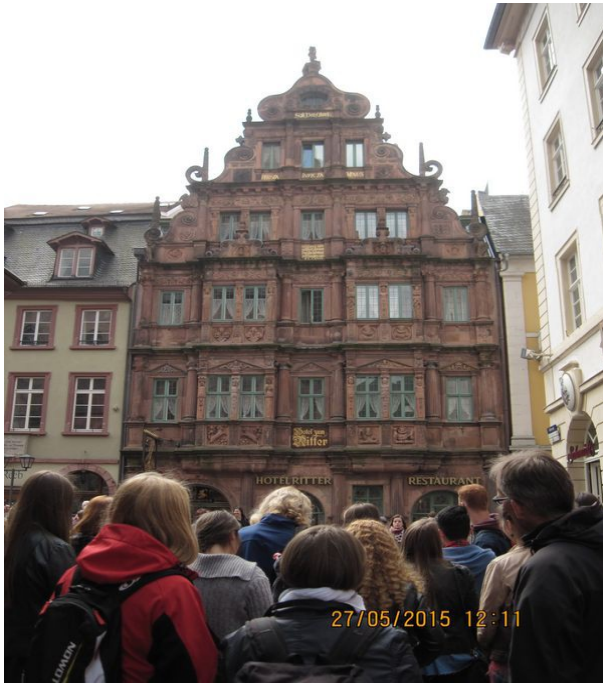
Heidelberg - spacer po Starym Mieście