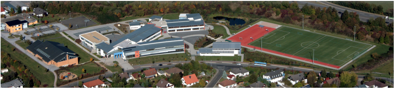
Budynek szkoły i kompleks sportowy