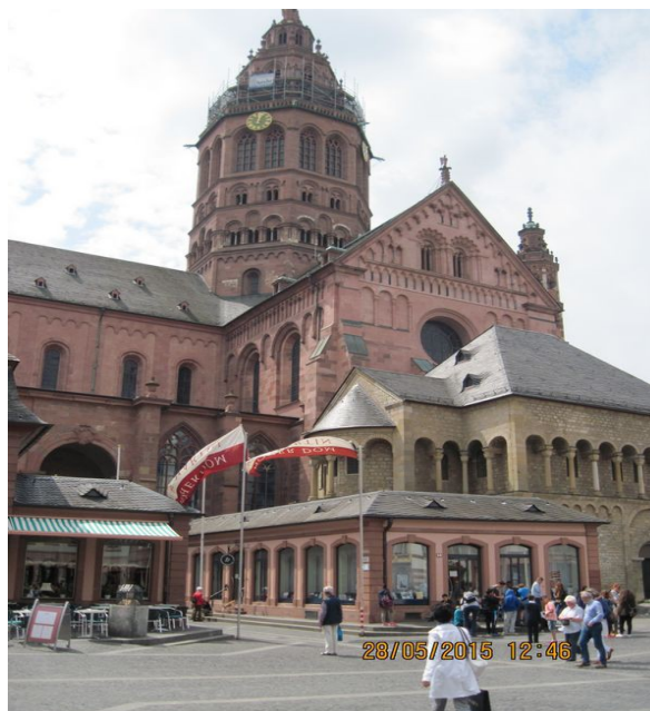
Katedra arcybiskupia w Moguncji (Mainz)