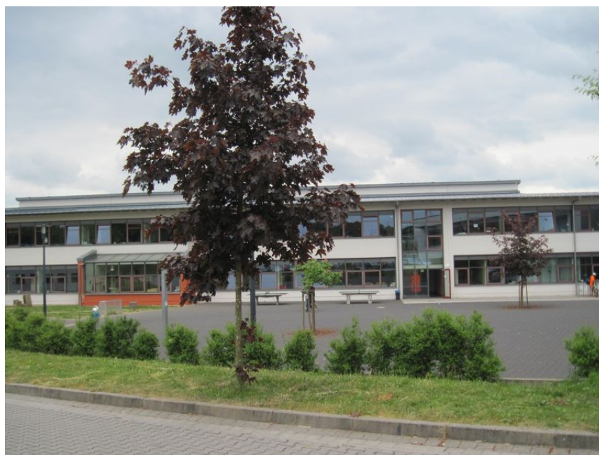
Budynek szkolny Integrierte Gesamtschule Stromberg